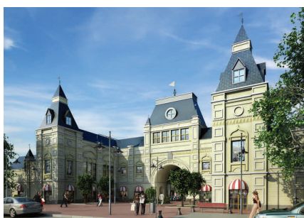
Fashion House Moscow